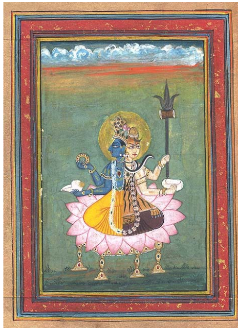
Hari - Hara